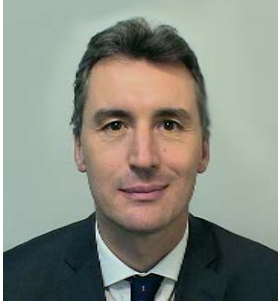
أكسل بيريو نائب الرئيس المكلف للأبحاث